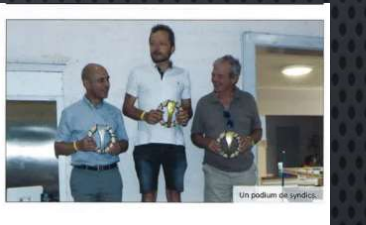
Un podium de syndicats.

Grand Prix des Municipalités La Municipalité d'Éclépens n'a pas pu se présenter sur la ligne de départ du plus long circuit d'Europe des petites voitures électriques, la course d'Éclépens. Les Municipalités ont permis aux trois concurrentes en face de se retrouver sur le podium avec pour vainqueur celle de Bavois, suivie de Goumoens, puis de Chavornay. Les concurrents ont été très concentrés.